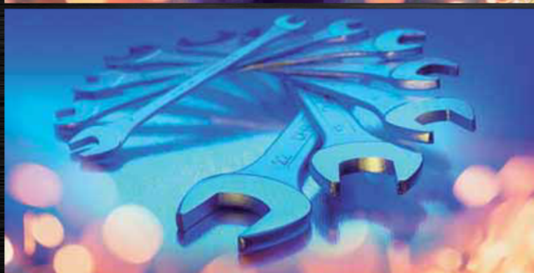
Scule de mana