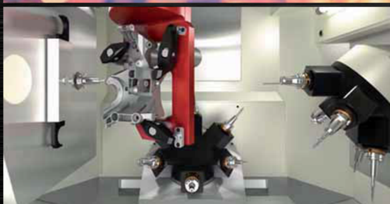
Masini unelte speciale cu comanda altanumerica